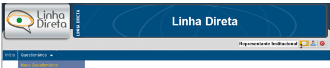
Figura 4 – Opção de menu

O coordenador deverá selecionar a opção de menu “Questionários” > “Meus Questionários” (Figura 4).